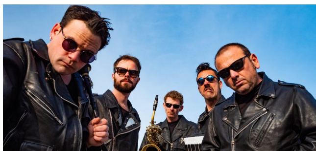
Une Menace d'Eclaircie