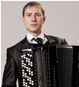
Vladislav Pligovka - Soloist of the Belarusian State Philharmonic Hall, teacher of the Belarussian State Academy of Music, winner of the international competitions (Belarus)