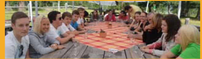
Orchesterreise 2013 in die Schweiz Besuch der Schaukäserei Alp Morteratsch

Alle Teilnehmer des Akkordeon-Musikpreises, die für ihre musikalische Leistung das Prädikat „hervorragend“ oder „ausgezeichnet“ erhalten und mind. 15 Jahre alt sind (Jahrgang 1999), werden eingeladen zum Sommerorchester 2015 der DHV-Akkordeonjugend Baden-Württemberg.