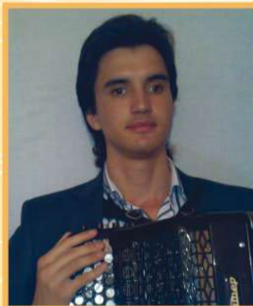
Eldar Abduraimov Эльдар Абдураимов