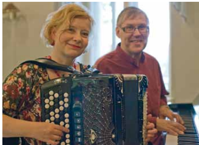
Maria Kalaniemi ja Timo Alakotila klo 22

– 02.00 Nuorekasta menoa puiston lavalla: Rockwalli Sami Hintsanen & Alabama House Band Laura Voutilainen Pubiteltassa Jaakko Laitinen & Väärä Raha. Liput 15 € / 10 €