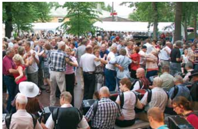
Juhlailta Festivaalipuistossa klo 22

Ilmailutapahtuma Jämi Fly In tervehtii juhliavaa Sata-Häme Soi -festivaalia Kyrösjärven yllä. Katselualue pesäpallokentän rinne. Vapaa pääsy