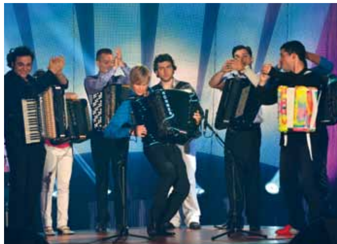
Kansainvälinen Primus Ikaalinen klo 19