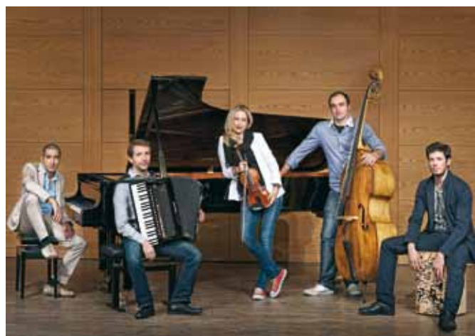
Munich Groove Connection klo 22

Häikäisevä kvintetti, joka liikkuu musiikin tyyliä toiseen sujuvasti pitkin huimaa jazzimprovisaatioita. Muusikot tulevat Bulgariasta, Georgiasta ja Moldovasta eivätkä peittele kotimaidensa musiikillisia juuria. Oma Tupa Liput 30 €