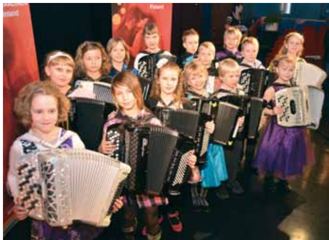
Lasten Hopeinen Harmonikka klo 19